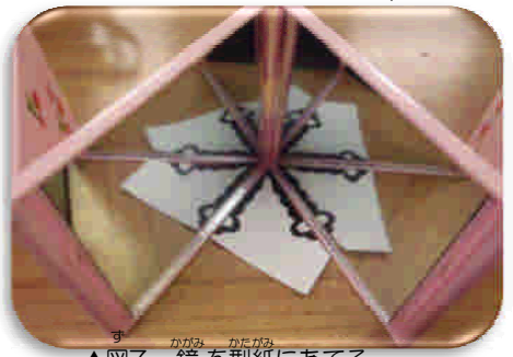
▲図7 鏡を型紙にあてる。

鏡に映る綺麗な模様！！ 図7のように鏡を型紙にあてると、出来上がった時の模様がわかります。これを使って、自分オリジナルの紋切りの型紙を作ってみましょう。